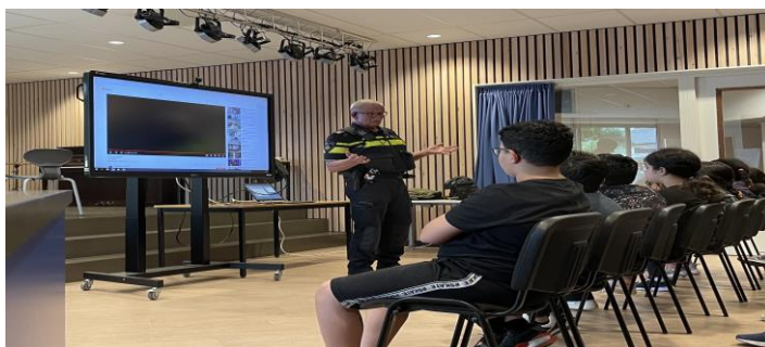
De wijkagent komt lesgeven

Daarop is (binnenkort) van alles te vinden op het gebied van sport en cultuur. Voor mensen van 0 tot 100. Je kan zoeken op leeftijd en op activiteit. En op wijk. Of op sporten voor specifieke doelgroepen. Neem eens een kijkje, wie weet staat er iets voor je bij.