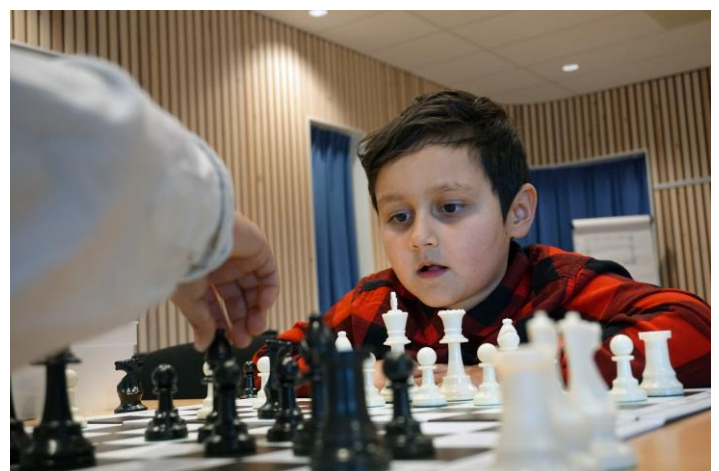
schaken vraagt concentratie

Wilt u meer weten over het onderzoek of de resultaten? Het verslag is binnenkort te vinden op onze website. U kunt dit ook ontvangen, stuur een email naar d.marseille@bredeschoolovervecht.nl en wij sturen het u toe.