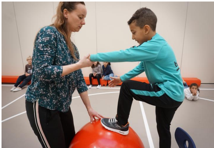
leren lopen op de circusbal

Ouders vinden het belangrijk dat kinderen plezier maken en spelen met andere kinderen. Maar ook bewegen en buiten zijn en daarnaast ondersteuning bij schoolprestaties vinden ouders belangrijke bezigheden.