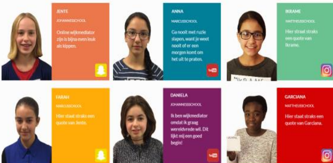
DE ONLINE WIJKMEDIATOREN VAN OVERVECHT

Mira Media Dit artikel stond eerder in langere versie in de Nieuwsbrief van Mira Media. Daar kan je ook meer vinden over Mira Media of over de website van de wijkmediatoren.