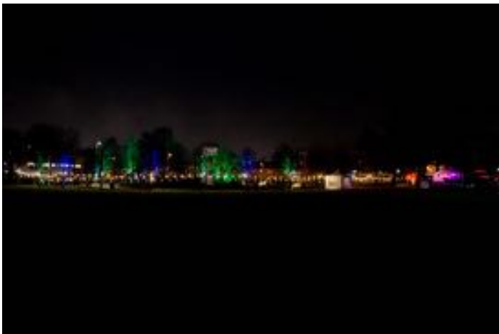
Weg van Kunst Hoograven 2020

Anne-Marie: “Ik probeer leerlingen en leerkrachten te inspireren door de werkwijze van onze theatermakers de school in te brengen. Het is mooi en belangrijk dat kinderen op jonge leeftijd kunnen ervaren dat er meer is dan dat waar je al bekend mee bent. Of het nou gaat om beeldende lessen, theater, dans of muzieklessen, voorop staat dat leerlingen kunnen ontdekken hoe geweldig het is om met gebruik van je eigen creativiteit en nieuwsgierigheid iets nieuws te ontwikkelen. Iets waar je trots op kunt zijn en dat je kunt delen met anderen.”