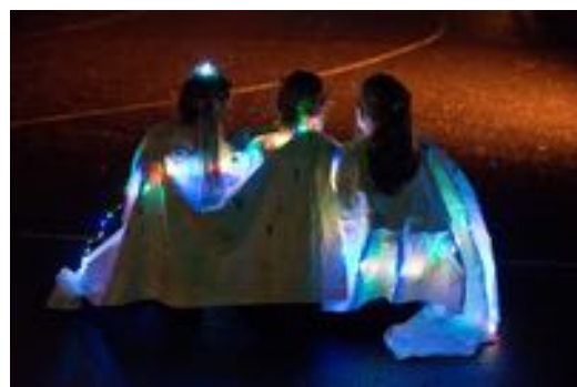
Weg van Kunst 2020

De volgende nieuwsbrief van Brede School Hoograven komt uit in januari 2022.